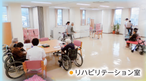
●リハビリテーション室