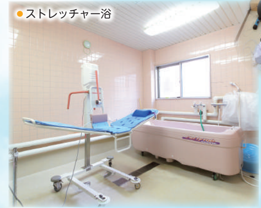
●ストレッチャー浴