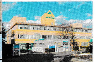
福島南循環器科病院